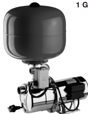
1 GP S

Zestaw wyposażony w pompę j.w., łącznik 5-cio drogowy, manometr, wyłącznik ciśnieniowy oraz kabel zasilający 1,5 mb z wtyczką, bez zbiornika, przystosowany do montażu pionowego zbiornika przeponowego