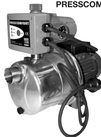
1 GP PRESSCOMFORT

Kompletny zestaw wyposażony w pompę j.w. zbiornik przeponowy 24 l, poziomy, trójnik, manometr, wyłącznik ciśnieniowy oraz kabel zasilający 1,5 mb z wtyczką.